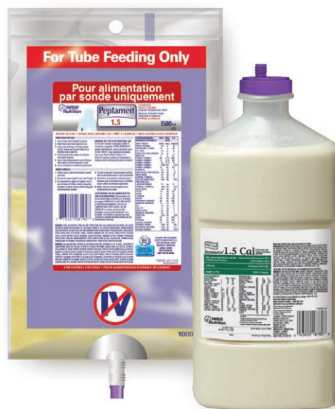
Une alimentation liquide, en sac et en bouteille

Il en existe plusieurs formules, adaptées aux besoins des patients. Les antécédents médicaux, les allergies ou les intolérances alimentaires peuvent influencer le choix de la formule.